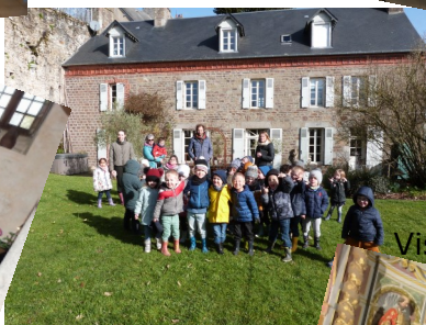
Visite du château