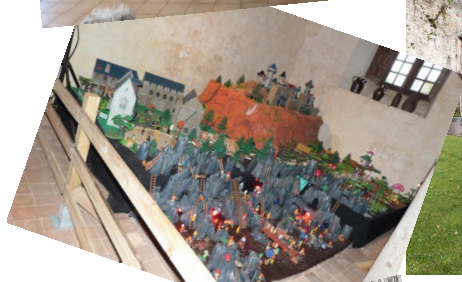
Légende des 3 fees