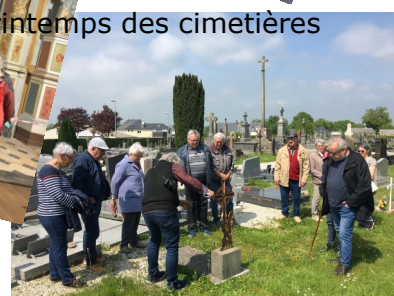
Printemps des cimetières