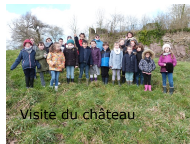
Visite du château