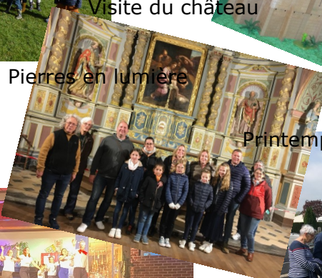
Pierres en lumière