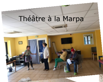
Théâtre à la Marpa