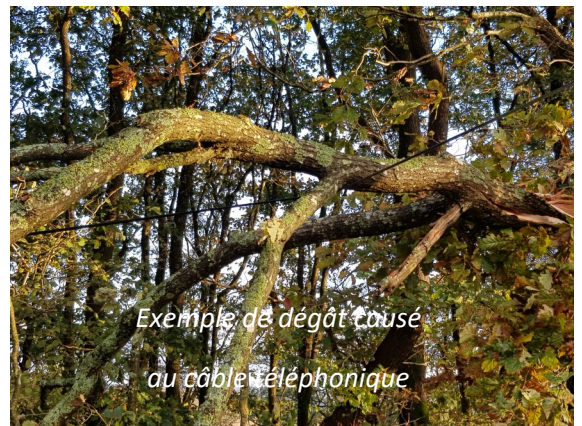
Exemple de dégât causé au câble téléphonique

coupures et autres défaillances. Le contenu du projet de loi relative à l'entretien et au renouvellement du réseau des lignes téléphoniques