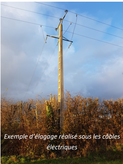
Exemple d'élagage réalisé sous les câbles électriques

porté par un député du Puy de Dôme a finalement intégré la loi pour la République numérique du 7 octobre 2016, laquelle a rétabli la servitude d'élagage. Le propriétaire d'un terrain doit assurer le débroussaillage, la coupe d'herbe, l'élagage et l'abattage des arbres lorsque cela est nécessaire afin de prévenir l'endommagement des équipements du réseau téléphonique et l'interruption du service. En cas de défaillance, ces opérations sont