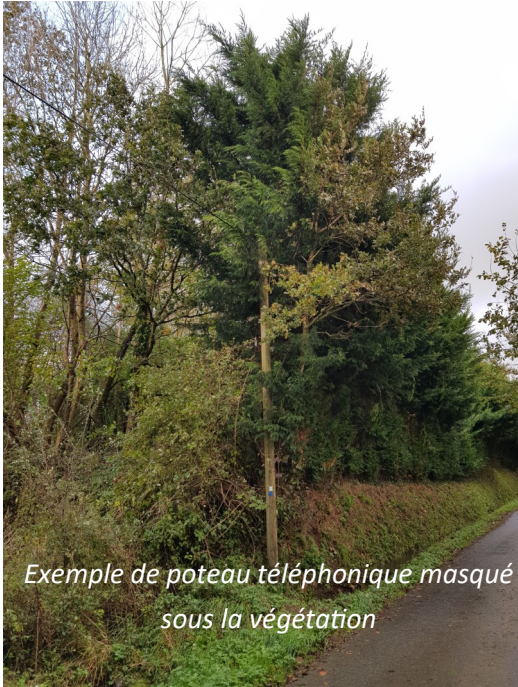
Exemple de poteau téléphonique masqué sous la végétation

Les riverains doivent obligatoirement élaguer les arbres, arbustes ou haies en bordure des voies publiques ou privées, de manière à ce qu'ils ne gênent pas le passage des piétons, ne cachent pas les feux de signalisation et les panneaux (y compris la visibilité en intersection de voirie). Les branches ne doivent pas toucher les conducteurs aériens EDF, Orange et l'éclairage public. L'élagage, ou taille des arbres, consiste à couper les branches les plus longues pour des raisons d'esthétique, de santé de l'arbre ou de rendement, mais aussi pour éviter de nuire à un tiers. L'élagage ne doit pas conduire à la suppression d'une haie, par ailleurs indispensable pour la bonne santé du bocage. Jusqu'en 1996, grâce à la servitude d'élagage, France Télécom pouvait faire élaguer, à la place des propriétaires de terrains, les branches d'arbres menaçant ses lignes. Ce dispositif a été abrogé dans le cadre de la libéralisation des